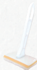
コテ刷毛 (セット販売もごさいます。)

※ 針葉樹・ブラックウォルナット・アカシアなどの樹種はオイルの吸い込みが多く、上記塗り面積より小さくなる場合がありますのでご注意ください。