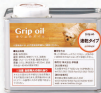
Grip oil/滑り止めオイル 速乾タイプ 0.5L