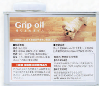
Grip oil/滑り止めオイル 0.5L