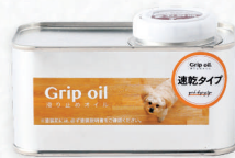
Grip oil/滑り止めオイル 速乾タイプ 0.25L