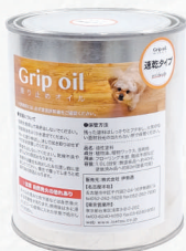
Grip oil/滑り止めオイル 速乾タイプ 1.0L