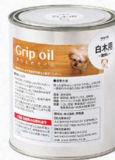
Grip oil/滑り止めオイル 白木用 1.0L