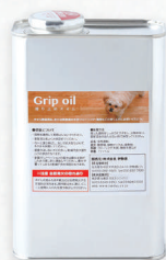
Grip oil/滑り止めオイル 1.0L