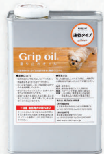
Grip oil/滑り止めオイル 速乾タイプ 1.0L