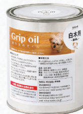
Grip oil/滑り止めオイル 白木用 1.0L