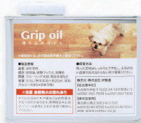
Grip oil/滑り止めオイル 0.5L