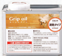
Grip oil/滑り止めオイル 速乾タイプ 0.5L