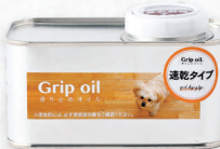
Grip oil/滑り止めオイル 速乾タイプ 0.25L