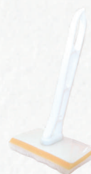
コテ刷毛 (セット販売もございます。)

※ 針葉樹・ブラックウォルナット・アカシアなどの樹種はオイルの吸い込みが多く、上記塗り面積より小さくなる場合がありますのでご注意ください。